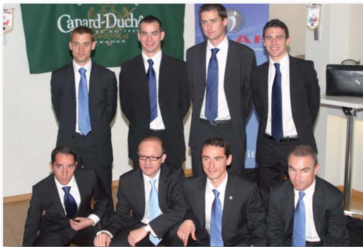
Les deux quatuors avant de prendre la route du Stade de France.

Comme avant chaque finale de Coupe de France et de Coupe Gambardella-Crédit Agricole, l'UNAF organise une réception dans les locaux de la FFF pour mettre à l'honneur les arbitres de ces matches particuliers, et les anciens qui arrêtent leur carrière. La tradition a été respectée le 1er mai dernier.