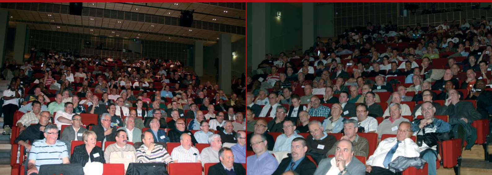
Une assemblée studieuse et attentive aux problèmes soulevés par la représentativité des arbitres dans les instances régionales et départementales.