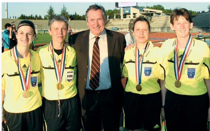
Le quatuor féminin de la finale du Challenge de France a été félicité par le DTN Gérard Houllier.